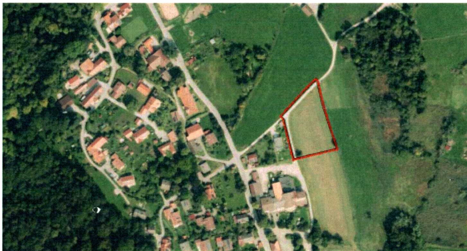
Abb. 1 Lage des Planungsgebietes im Ortsteil Paterzell (rot)

Der bisher als Fläche für die Landwirtschaft und Mischbaufläche dargestellte Bereich, soll als Sonderbaufläche mit der Zweckbestimmung „Paterzeller Hüttendorf“ dargestellt werden. Ziel ist es, das touristische Angebot im Gemeindebereich zu erweitern.